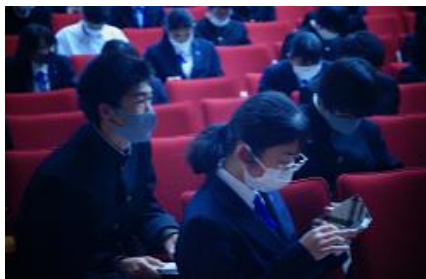
詳細な講座資料は事前にダウンロードしたスマホやタブレットを見ながら