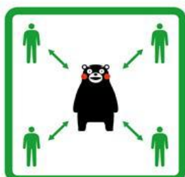
くっつかないモン #KeepDistance